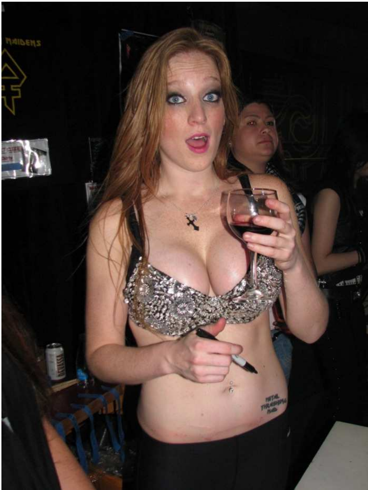
Up the Iron Maiden(s)!